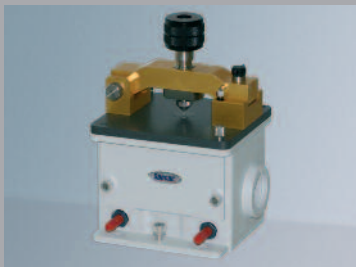
Golden Gate Diamant ATR Einheit